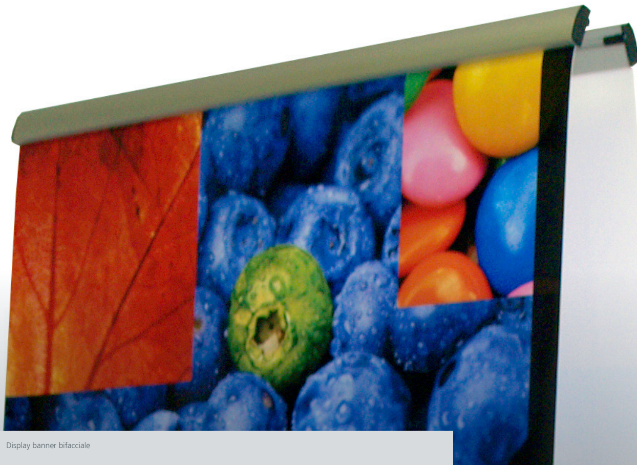
Display banner bifacciale