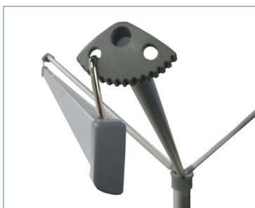
Fissaggio superiore Display per banner trifacciale