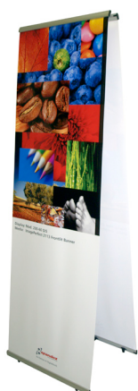
Display banner bifacciale