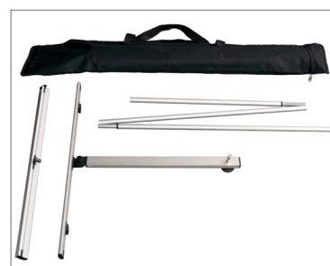
Completo di borsa in nylon Display mono e bifacciale