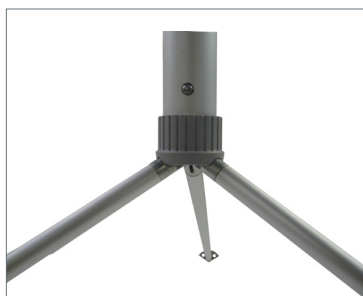
Fissaggio inferiore Display per banner trifacciale