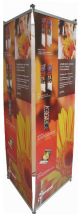
Display banner trifacciale