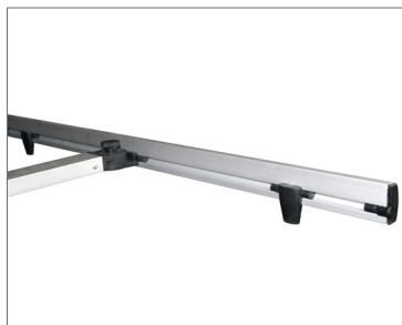
Fissaggio inferiore Display per banner monofacciale