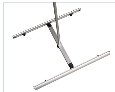
Fissaggio inferiore Display per banner bifacciale