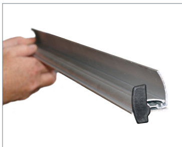
Sistema superiore Banner-Fix