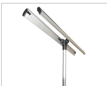
Fissaggio superiore Display per banner bifacciale