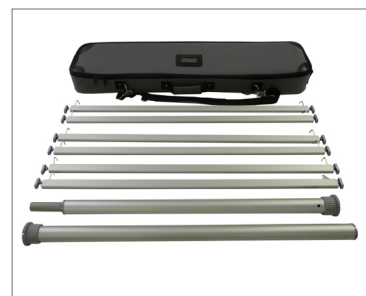
Completo di borsa imbottita Display trifacciale